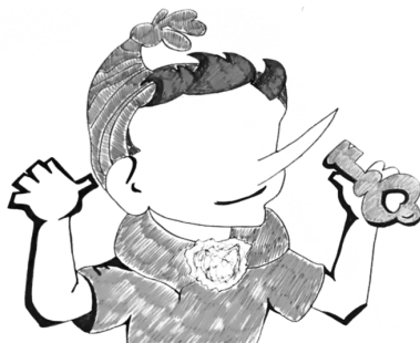
Рис. П2.3. Пример «Буратино»