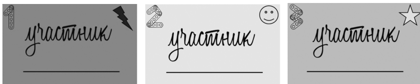
Рис. П2.1. Пример карточек участника. Цифры, фигуры и цвет карточек меняются между собой для разделения участников по разным командам все три этапа